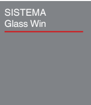
CÁLCULO DE AISLAMIENTO ACÚSTICO. Según UNE EN 14351:2006+A1:2011.

Con la garantía de KÖMMERLING® Sistemas de ventanas